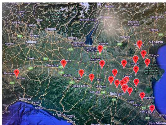
Fig.1 Località monitorate con Irriframe