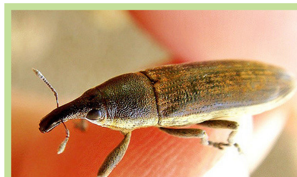
Foto 1 Adulto di lisso.

Gli adulti non sono pericolosi ma le larve possono creare rosure ai piccioli fogliari (foto 2) determinando, con decorsi climatici molto caldi, il disseccamento dell'apparato fogliare, l'approfondimento delle larve al colletto e l'innescò di marcescenze a livello radicale.