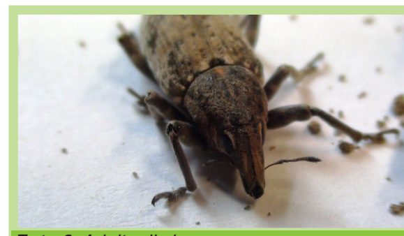
Foto 3 Adulto di cleono.