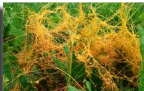
Foto 3. infestazione in stadio avanzato contenibile solo parzialmente

Tabella 1. Dosi a ettaro di Kerb 80 EDF per il contenimento della cuscuta.