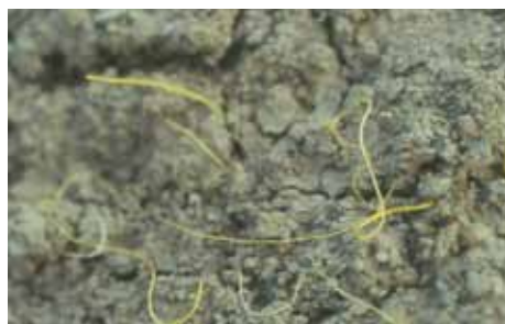
Foto 1. cuscuta appena emersa dal terreno