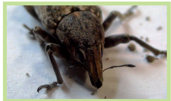
Figura 2. Adulto di cleono.