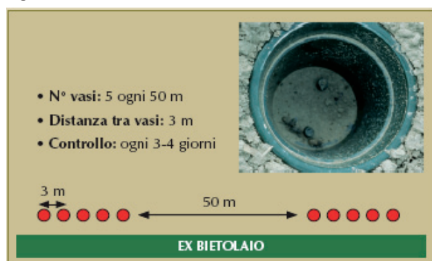
Figura 3. Schema su come monitorare il cleono

Il cleono fuoriesce dai luoghi di svernamento in modo scalare nel periodo Marzo-Aprile andando successivamente alla ricerca delle bietole. Per questo prima di trattare è consigliabile fare un monitoraggio in campo mediante dislocazione di vasetti lungo le aree perimetrali del campo come indicato nella figura sottostante. Si consiglia di trattare quando si supera la soglia di 1-2 adulti di cleono catturati in una settimana per ogni vasetto. Prestare attenzione alla comparsa delle rosure sulle giovani foglie, alla presenza di adulti nel bietolaio e al numero di catture nel caso si esegua il monitoraggio. Trattare con piretroidi (miscibili con gli erbicidi) o con altri insetticidi riportati in tabella 3. La concia delle bietole (Poncho Beta e Cruiser) svolge una buona azione anche nei confronti del cleono durante le prime fasi di sviluppo, pertanto occorre prestare la massima attenzione ai trattamenti dalla fine di Aprile a Maggio .